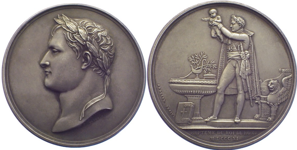
Medaille uitgegeven in 1811 ter gelegenheid van de geboorte van de zoon van Napoleon

In 1800 waren drie gemeenten gevormd door samenvoegingen van dorpen die nu grotendeels de huidige gemeente Horst aan de Maas uitmaken, namelijk Horst-Sevenum, Grubbenvorst-Lottum en Broekhuizen-Broekhuizenvorst. In alle gemeenten van het kanton Horst werden op zondag 2 juni 1811 feesten georganiseerd ter gelegenheid van de geboorte van de zoon en troonopvolger van Napoleon.