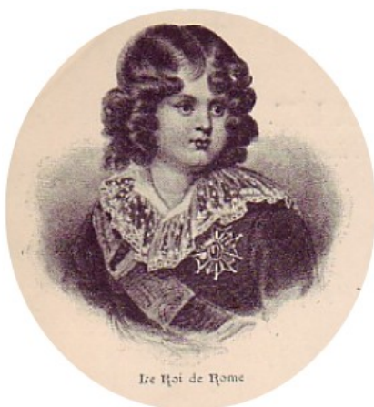
Afbeelding Le Roi de Rome, Napoleon II.