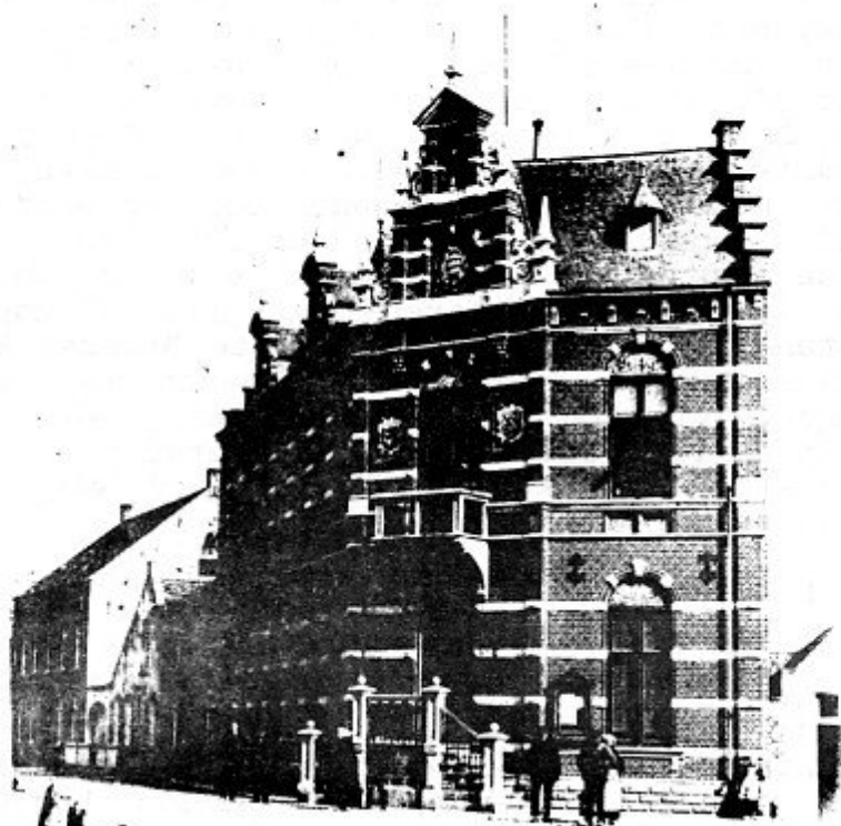
Oude raadhuis ca. 1900