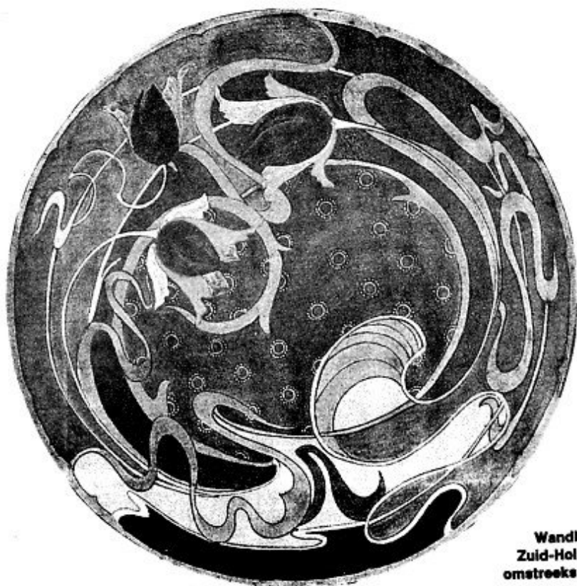
Wandbord, Zuid-Holland, omstreeks 1906

In de jaren 1880 tot 1930 maakte de kunstnijverheid in ons land een periode van bloei door. Nederlandse ceramiek in Jugendstil en Art Deco stond ook internationaal gezien op hoog peil. Bekende bedrijven waren Rozenburg, Amstelhoek en De Ram. De collectie Douma geeft een fraai overzicht van deze bloeiperiode. Een brochure begeleidt deze expositie.