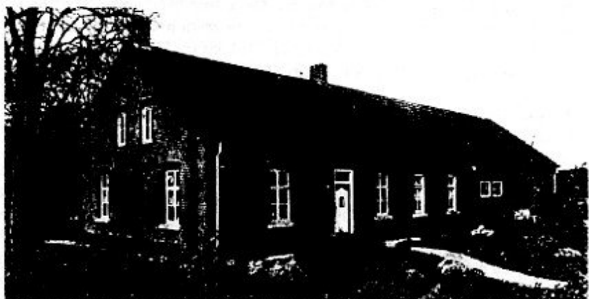
Boven: Wienes Hof (Hagelkruisweg 20) Onder: Fleurs Hof (Pastoor Debijestraat 9)