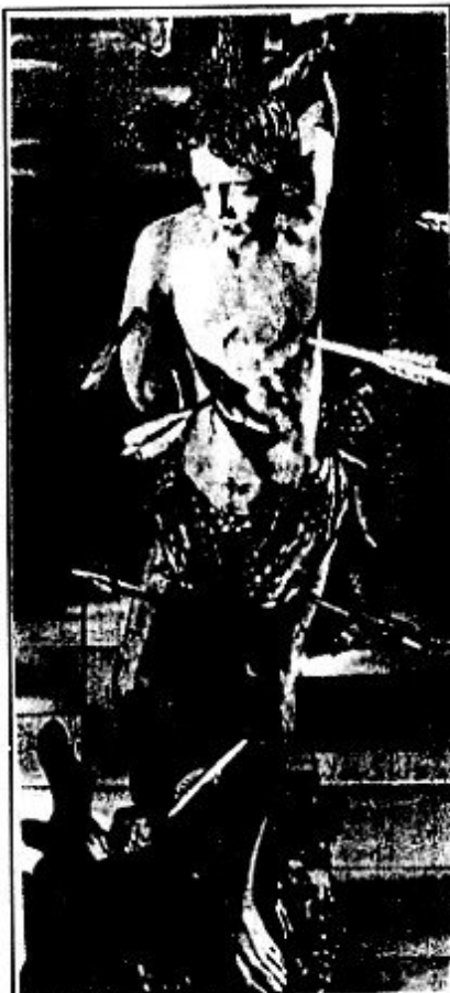
Een 18e eeuwse houten beeld van Sebastiaan in de kerk van Fabianus en Sebastianus in Sevenum.

Adres: Goltziusstraat 21, 5911 AS Venlo. Telefoon 077-596762.